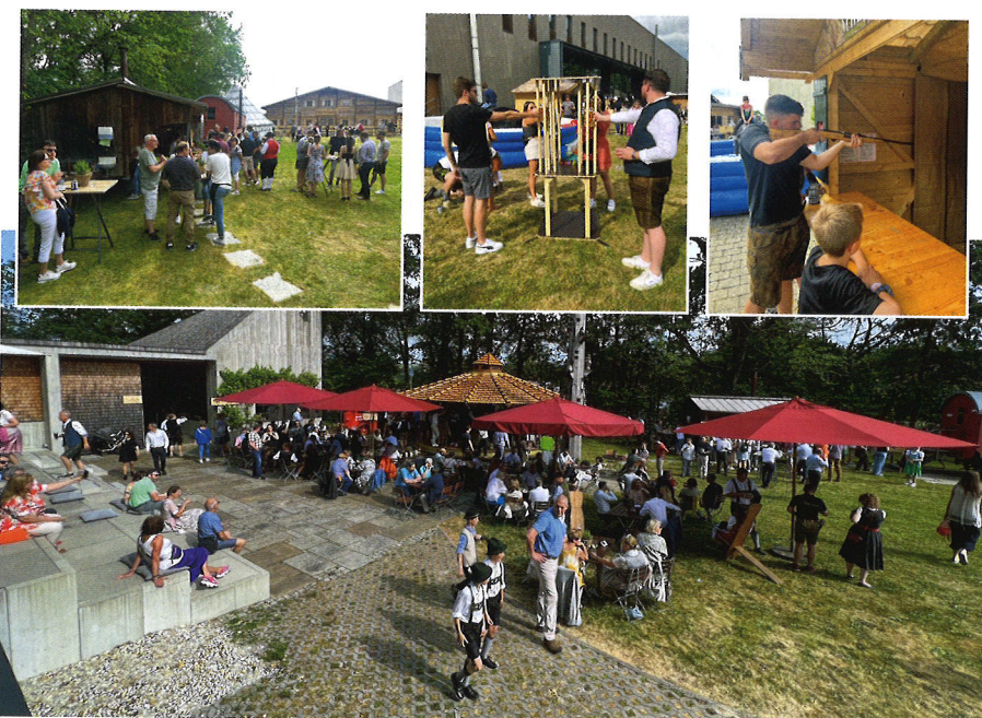
Buntes Treiben auf der Festwiese.